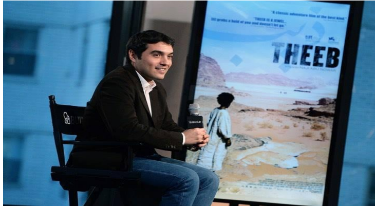
ناجی ئەبوو نهوا، له بارهی فيلمه كهی ده دویت

به لّام دواتر ليخوشبوونی بۆ ده رچوو. فيلمه كهی من، له بارهی ئەم تراژیدیایه و ئەو رۆژهیه، كه تییدا روودهدات، ههروهها سهبارهت به توورپهیییه له كایهی وهرزش و توورپهیییه له سهه شه قامدا.