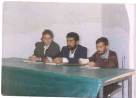
یه کهم کۆبونه وه بو سازدانی یه کهم فستیقای ئه نفال