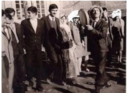
وینەیی زیرهک لهکاتی گۆرانی گوتن و دهفژمین دا

مانایه وه دیت ، ئەگەر گۆرانیهکانی بۆ تەلەفزیۆن تۆمار نەکردبێ ئەوا بۆ رادیوی تۆمارکردوون و کامیرای وینەیی فۆتوگرافی و کامیرای تەلەفزیۆنی تیدابوو ، له ( رهش و سپیی )هوه تا دهگاته ( رهنگاورهنگ )، ئەمه بۆ ئەومان دەبات دەبێ زیرهکی هونەر مەند بە هه ردوو جۆری وینەو فیدیوی زۆر هه بیتن و لهو وینانهدا به ئامێر هوه ده رکهوی !!، بهلام ، بهداخهوه هونەر مەند حەسەن زیرهک لهم رووه وه وینەیی سهردهمی عێراقی زۆر کهمه !! ئەگەرچی وینەو فیدیوی سهردهمی تاران و کرمانشان و بهگشتی ئێرانی زۆر تره، بهلام، ئەویش هیشتا زۆر نیهو زۆر فیدیوی تۆمار کراوی گۆرانی و ئاهه نگهکانی ناویان هه یهو رهنگیان نیه؟! ئەم وینەو فیدیویانەیی تۆمار کراوی کاتی گۆرانی و ئاهه نگهکان ، بهلگهیهکی باشن بۆ ئەوهی به دواي ئەوهدا بچین که ، ئایا زیرهک لهکاتی گۆرانی گوتن دا چ ئامێریکی موسیقی بهدهستهوه بووه؟! ئەوهی تا ئیستا ، لای کهم من دیومن و له بهردهست بن ، زیرهک له زۆر ئاهه نگ ، که وینەیی گیراوه له کاتی گۆرانی گوتن دا . تهنیا ( دهف – دائیره ) ی بهدهستهویه ! تا ئیستا من خۆم نهمدیوهو نهمبستهوه وینەیی زیرهک لهگهڵ هیچ ئامێریکی تری موسیقی گیرابیت !