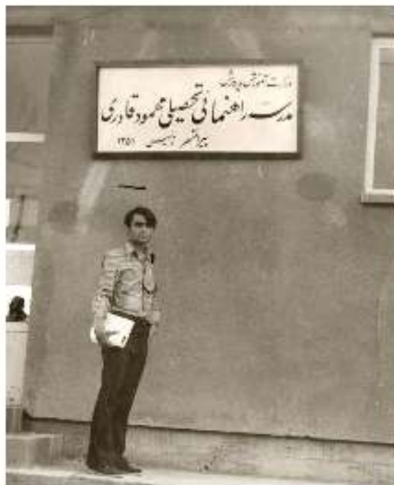
نویسنده: آقای دکترعلی کوروی زمانی شریعی، ۱۳۷۵