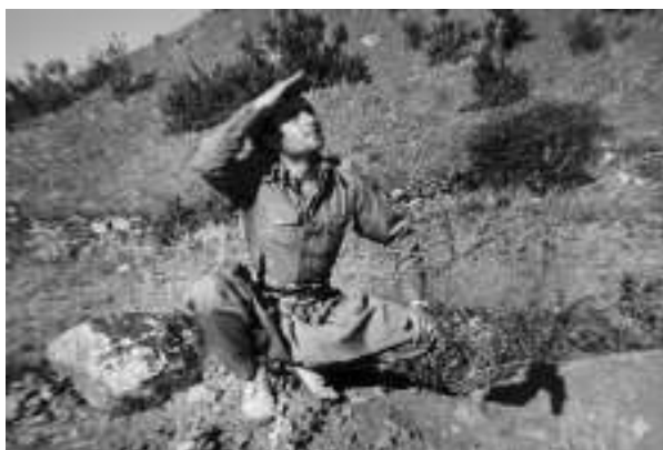
گوندی مهمیخه‌لان ، ده‌قهری باله‌کایه‌تی، باره‌گای نیستگه‌ی ده‌نگی کوردستان - 1974