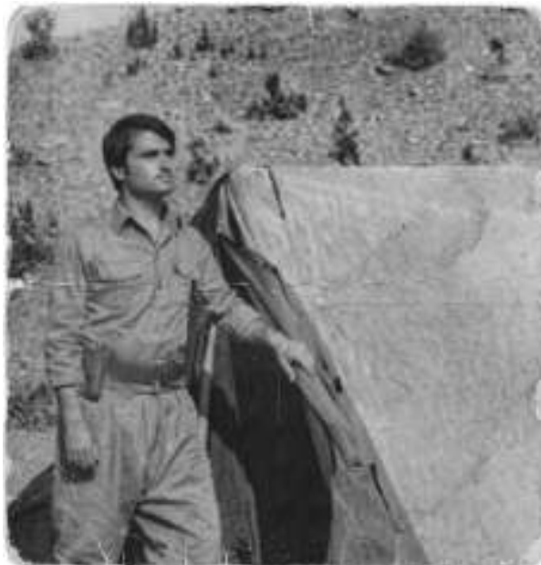
دەربەندى پايات - كانى كۆرىنەن بارەگاي كارمەندانى ئېستگەي دەنگى كوردستان - 1974