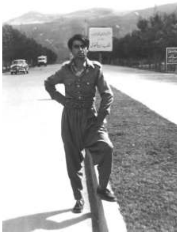
خانن (پيرانشار) 1975