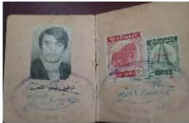
تاسنامى رۆننامىي التاسى، سالى 1973 - تەلە كەربەلا لە كۆل پەس، شۆرىي كەربەلا