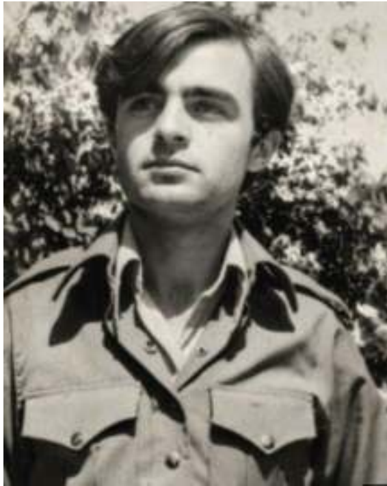
گوندی مهمیخه لان ، دهقهری باله کایه تی ، باره گای نیستگه ی دهنگی کوردستان – 1974