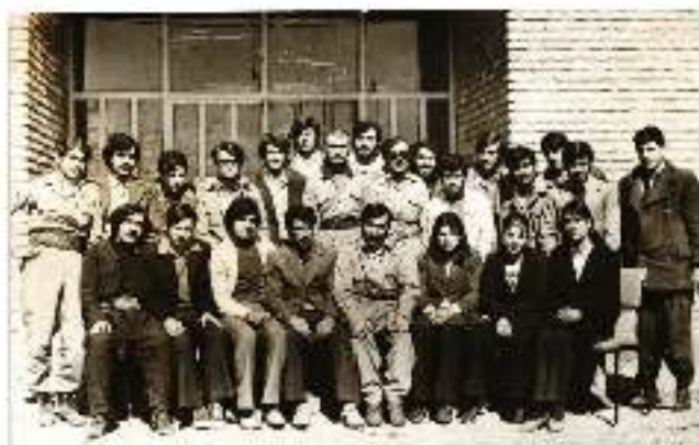
نوبسم له دستينكى دستينگرينموى خويىن دواى نىسكوى شورش نكهن ماموستا و قونايانى (بواناومدى زىماكو)، كوردووكاي زوه، مھىرى ماركھور كوردىسانى ئاران، 1975