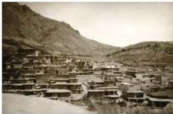
گەتتە مەھەلەدى شۇرشى ئەپەندول - زىدى ئۆيىدە