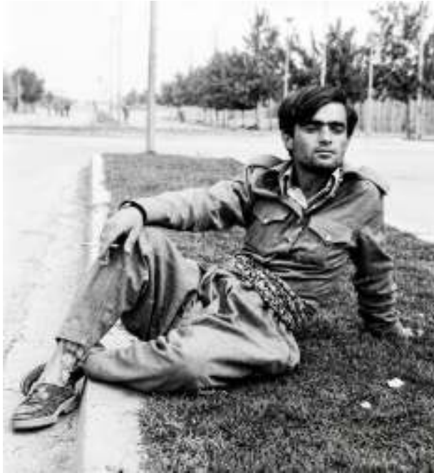
خانی (پیرانشار) 1975