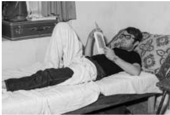
نوسه ره له نوتلیکی شاری ( رهشت ) دوای دوورخستهوهی له مهباد