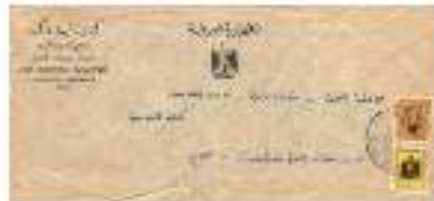
کوپن دستنویس نامه‌های ماموستا محمود مجاهدی له و هلمین نامه‌های مند نایبیت به له چندیان به‌نامین کوشنیرم سالن 1977