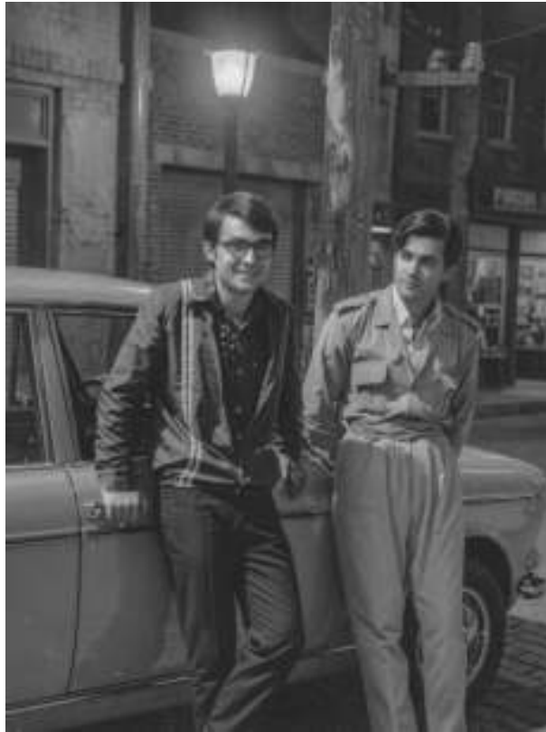
آزاد آندیانی - نهآاد عزیز سورمی- مههآباد - 1975