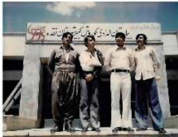
اڭ رايونىدا مىلەزم خەرىمان نەيەۋىيە كورامىلەزم خەتەمەن مىلەزم غوجىم غوجىمان زەھىم خە. ۋ نەزاد خەرىمان مىلەزم خەتەمەن اڭ ۱۵ ئاينى ۱۹۷۵ ئاينى ۱۵ كۈنى ئۆزبېكىستان ئۇنىۋېرسىتېتىدا بىر تەڭ يۈرۈۋ تەڭ تۇرغانىمىز ۱۹۷۵